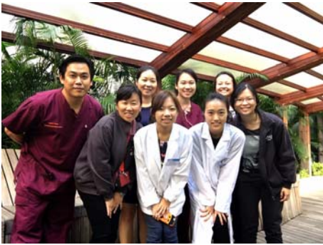
和治療部門的同仁合影