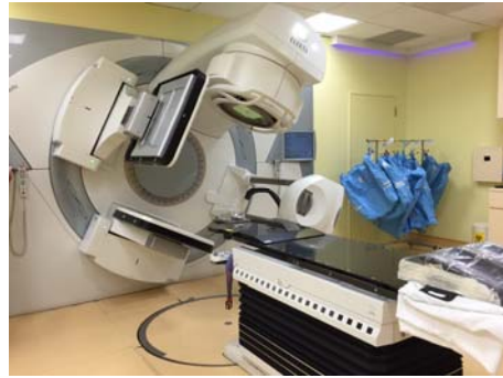
院內最新的治療儀器