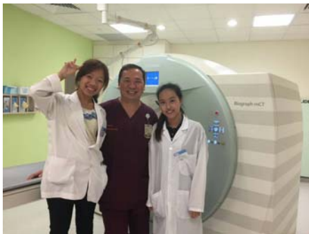
和 PET-CT 的學長合影