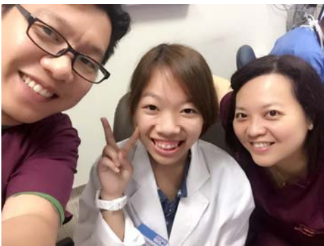
治療部門的學長姐合影